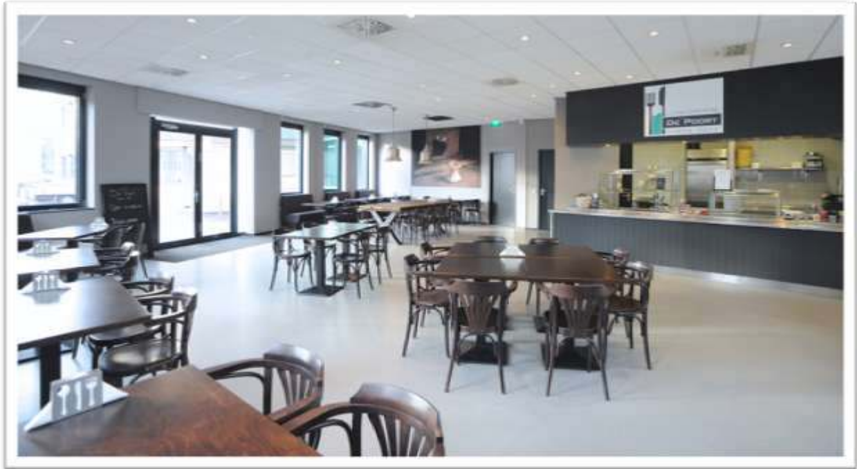
Restaurant begaande grond pand de Poort