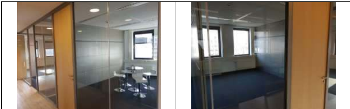
De vaste en flexibele kantoren Business center de Poort

Neem dan contact met ons op voor meer informatie of een bezichtiging. Mail ons op office@sparkwise.nl of bel ons op 020-800 62 55