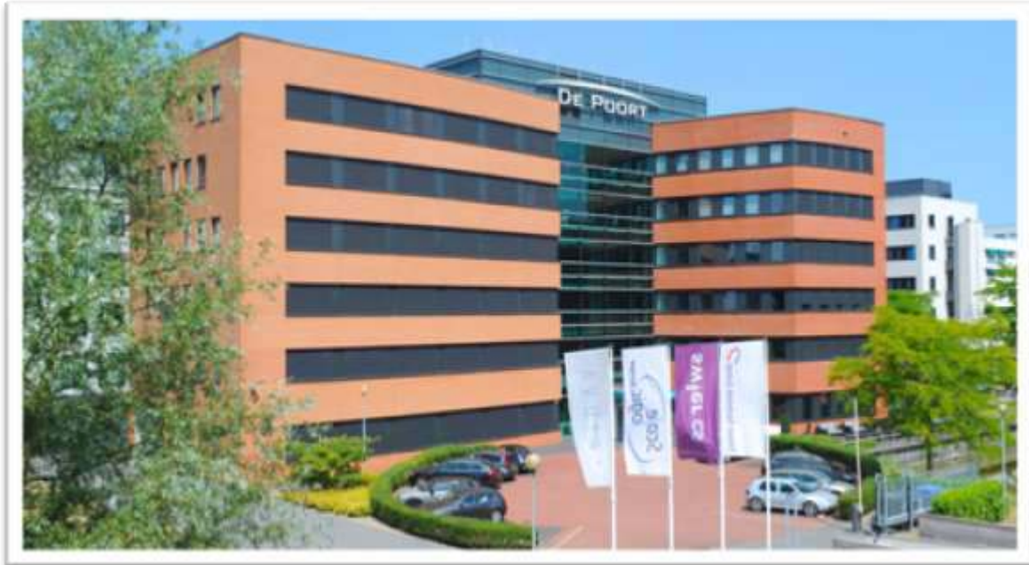
Pand de Poort Paalbergweg 44-46

Jouw off- en online platform voor commercieel succes